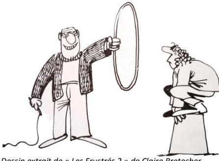
Dessin extrait de « Les Frustrés 2 » de Claire Bretecher

Une exposition documentaire illustrée, organisée par Potentielles à l'occasion du Mois des Droits des femmes 2015